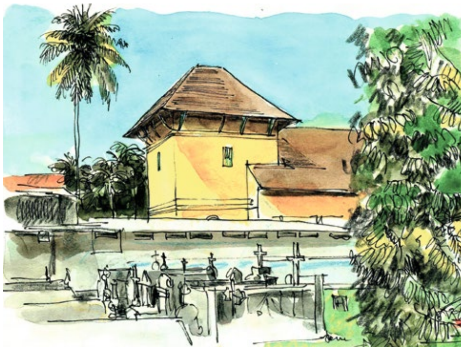
Thomas-Kirche in Angamaly, Kerala

ZEICHNUNGEN: RAINER SCHODER • TEXT RAINER HÖRIG