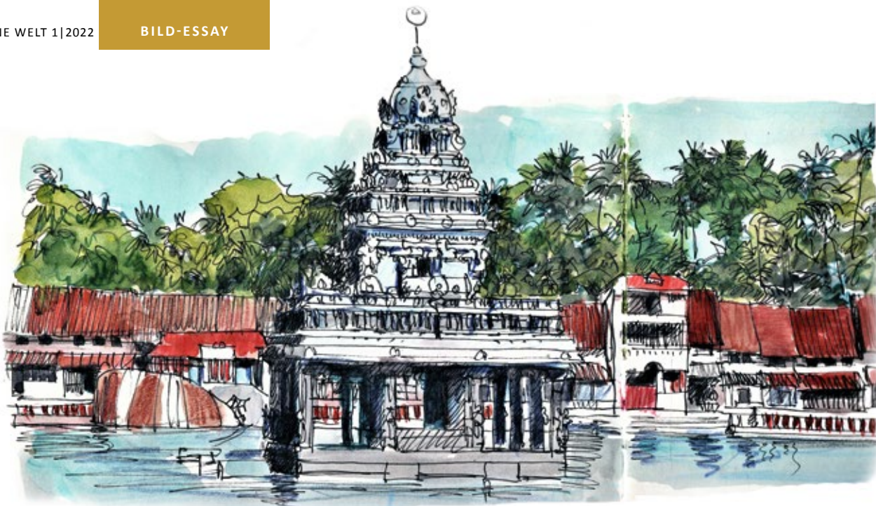
Suchindram-Tempel nahe Nagercoil, Tamil Nadu