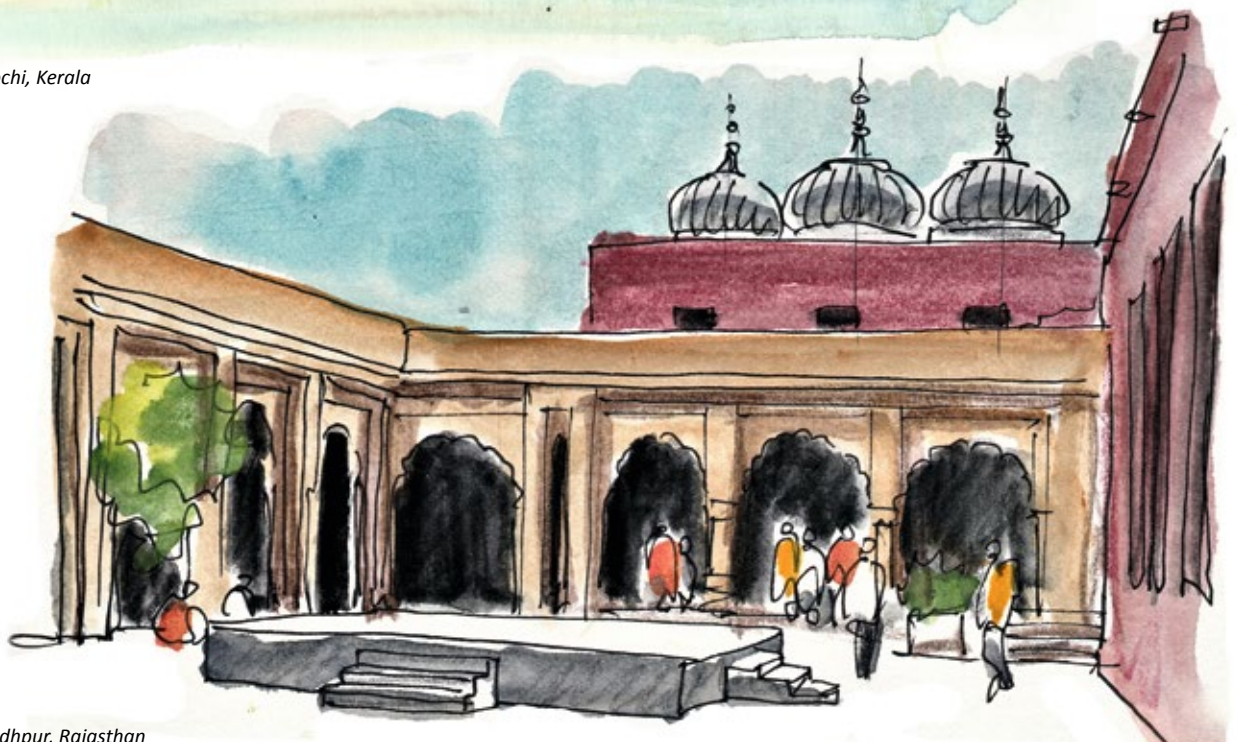
Jaswant Thada in Jodhpur, Rajasthan