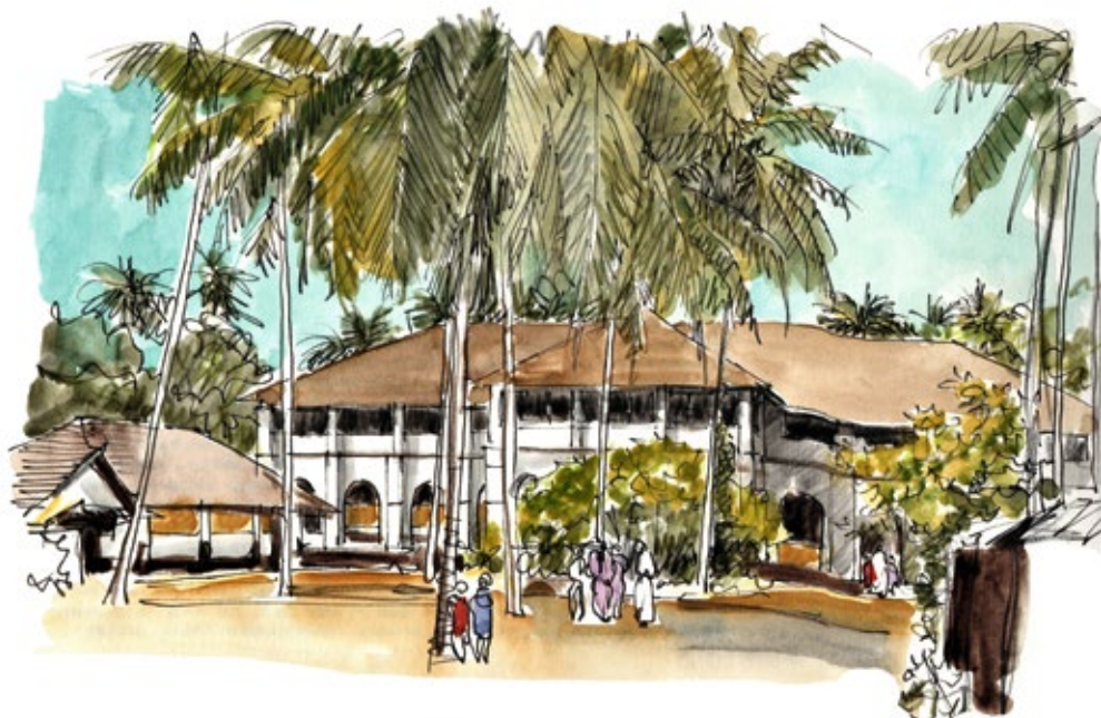
Gebäude der ehem. Basler Mission in Kozhikode, Kerala