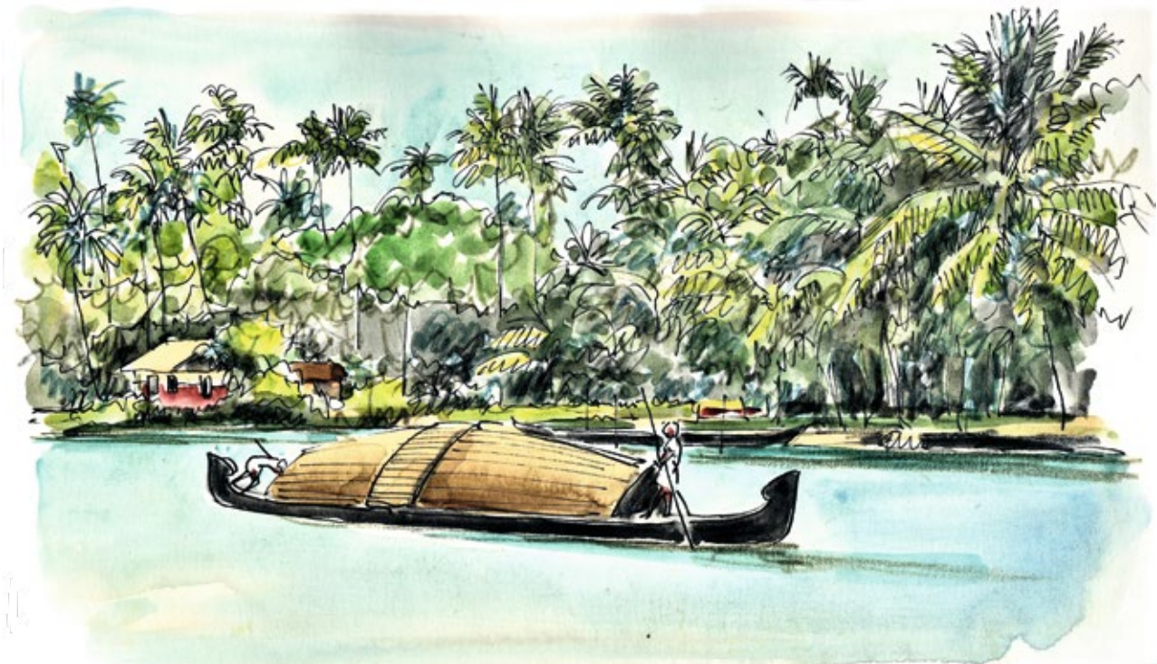
Backwaters nahe Kochi, Kerala