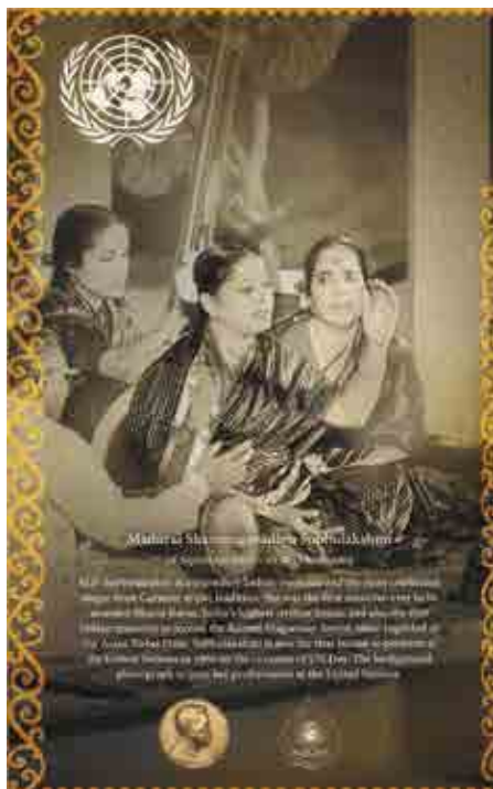
Die Sängerin M.S. Subbulakshmi (1916-2004), Reproduktion aus einer Sonderbriefmarke der Vereinten Nationen 2016