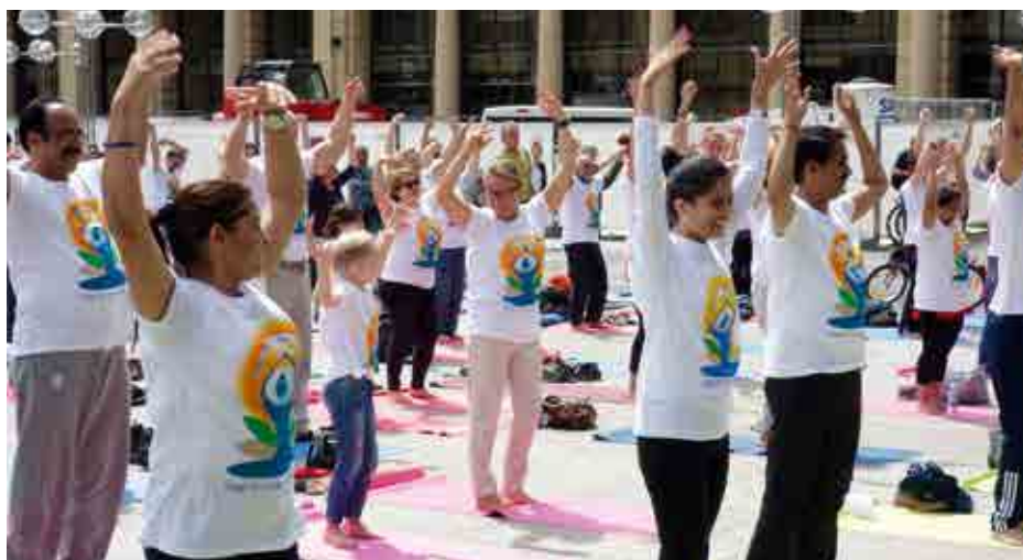
Öffentliche Yoga-Übungen beim Internationalen Yoga-Tag 2016 in Köln

Seit dem Jahr 2000 nahm die Migration aus Indien nach Deutschland stark zu, konstatiert der Geograf Carsten Butsch , der mehr als drei Jahre lang im Rahmen eines Forschungsprojektes an der Universität Köln die Situation indischer Migranten untersuchte. Mittlerweile leben rund 100.000 Menschen indischen Ursprungs in Deutschland. Die Studie „Transnationales Handeln indischer Migranten in Deutschland“ beschreibt die vielen verschiedenen Beweggründe und Lebensumstände der indisch-stämmigen Mitbürger und ihre Beziehungen ins Heimatland. Sie soll Ende 2018 als Buch erscheinen. Im folgenden fasst der Autor seine Forschungsergebnisse zusammen.