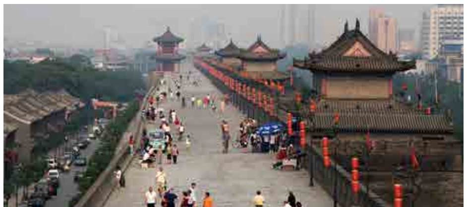
Die alte Stadtmauer in Xi'an, der Stadt, die den Beginn der historischen Seidenstraße markiert.

Dieser Beitrag ist eine überarbeitete Fassung eines Kapitels aus dem Buch: Uwe Hoering, Der Lange Marsch 2.0. Chinas Neue Seidenstraßen als Entwicklungsmodell. In Kooperation mit Stiftung Asienhaus. VSA-Verlag, Hamburg 2018 im Internet: https://www.asienhaus.de/nc/publikationen/detail/der-lange-marsch-20-chinas-neue-seidenstrassen-als-entwicklungsmodell/ https://www.vsa-verlag.de/index.php?id=6576&tx_ttnews[tt_news]=17695